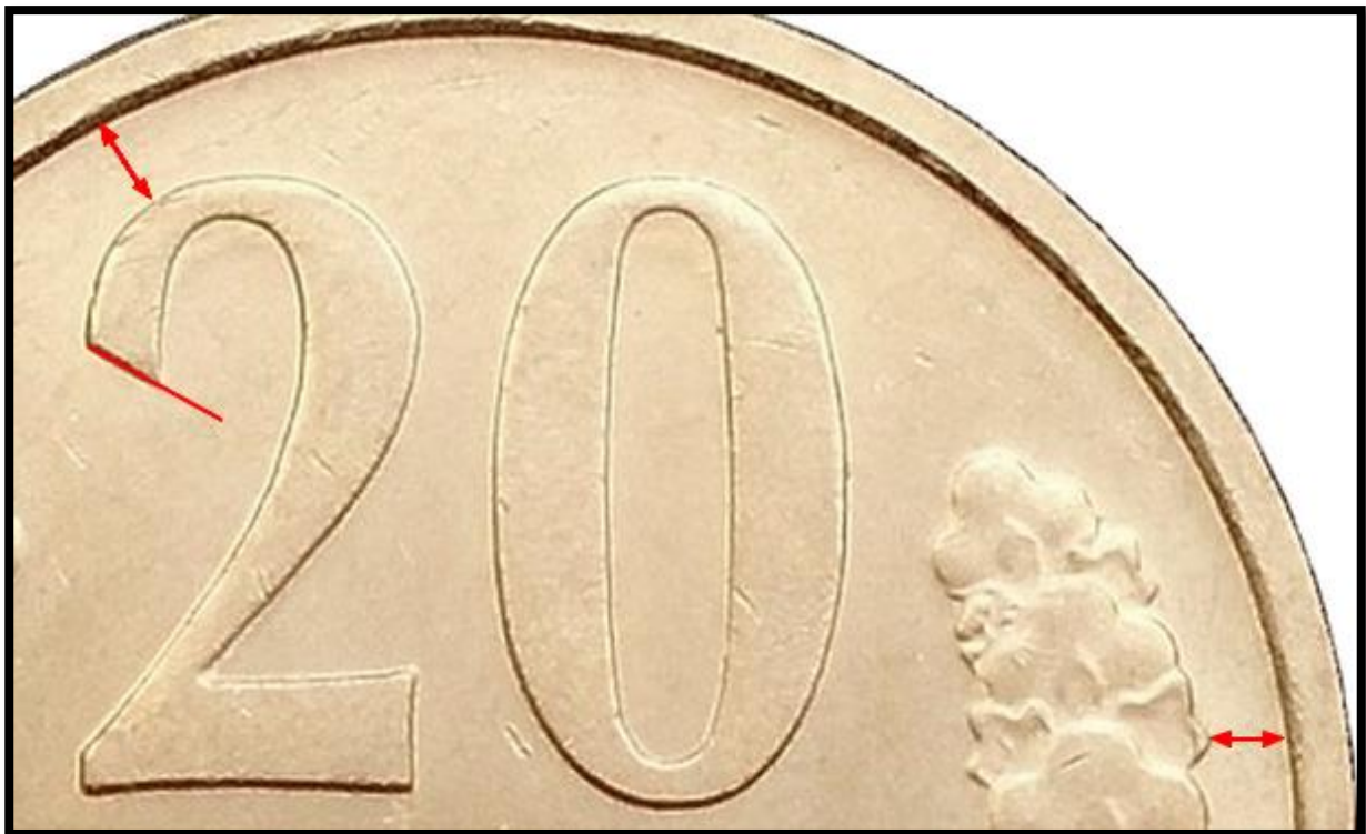
Type B/D/G Avers 2 : Grande gravure.