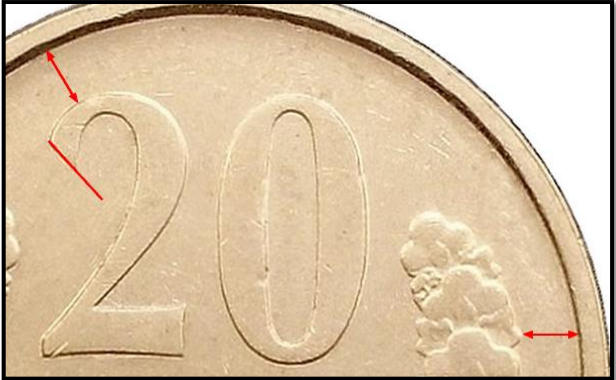
Type A/C/E/F Avers 1 : Petite gravure.