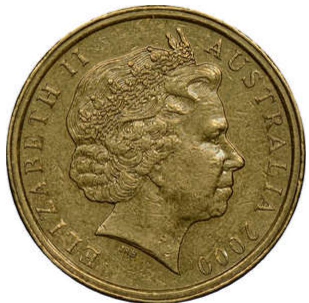
Type B Mule.