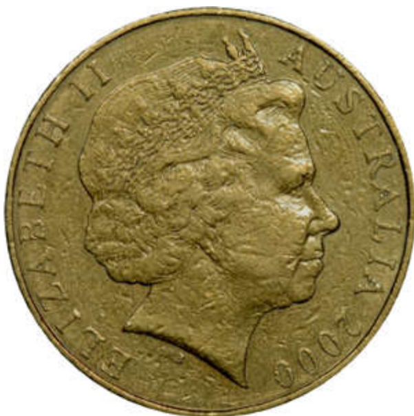
Type A Normal.