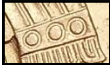
Type A Sans point.